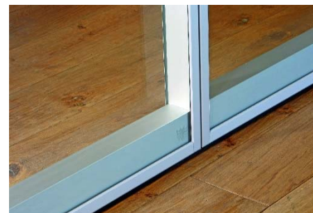
Hohe Transparenz durch minimale Rahmenkonstruktion