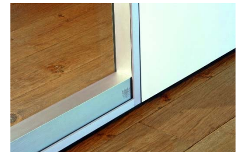
Kombinierbar mit allen Variflex 100 Elementen in einem durchgängigen Design