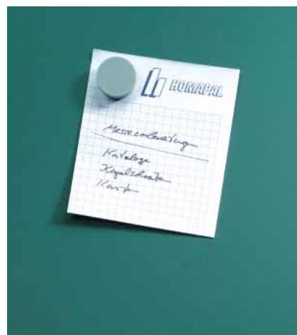
Magnetaftend und beschreibbar mit Kreide, grün Code: HP 8211