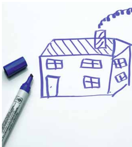
Magnetaftend und beschreibbar mit Marker, weiß Code: HP 8206