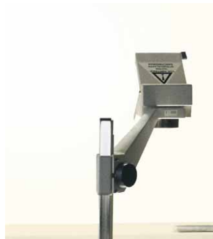
Projektionsoberfläche magnetaftend, weiß Code: HP 8217