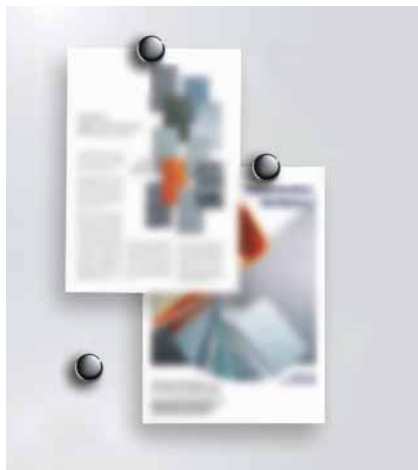
Magnetaftend und beschreibbar mit Marker, grau Code: HP 8208