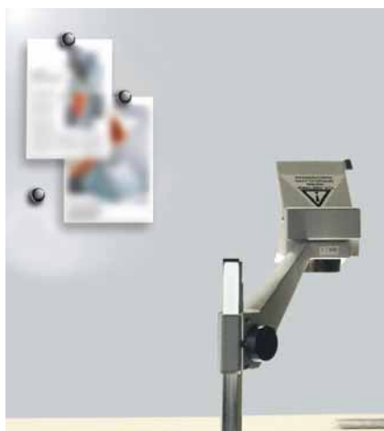
Projektionsoberfläche magnetaftend, grau Code: HP 8219